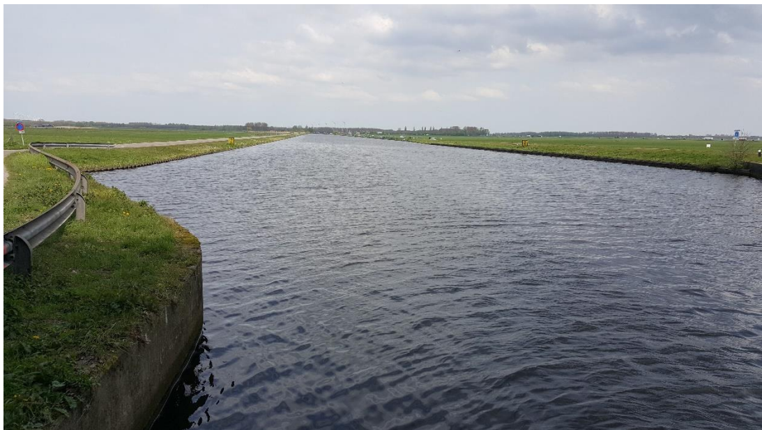
Figuur 6: Foto locatie tijdens veldbezoek op 17 april 2019.