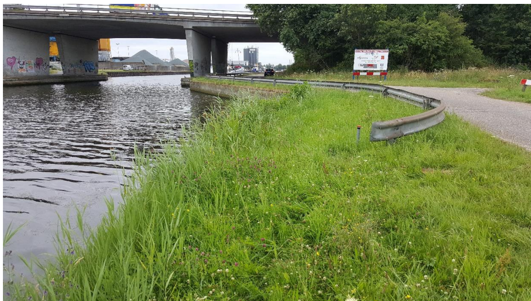
Figuur 4: Foto locatie tijdens veldbezoek op 16 juli 2019.