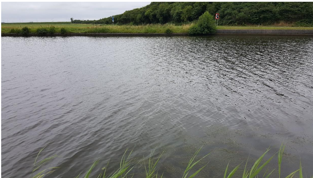
Figuur 2: Foto locatie tijdens veldbezoek op 16 juli 2019.