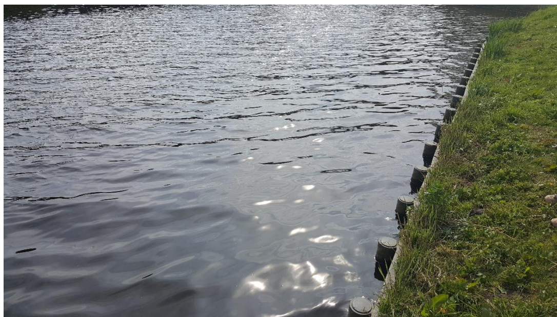
Figuur 5: Foto locatie tijdens veldbezoek op 17 april 2019.