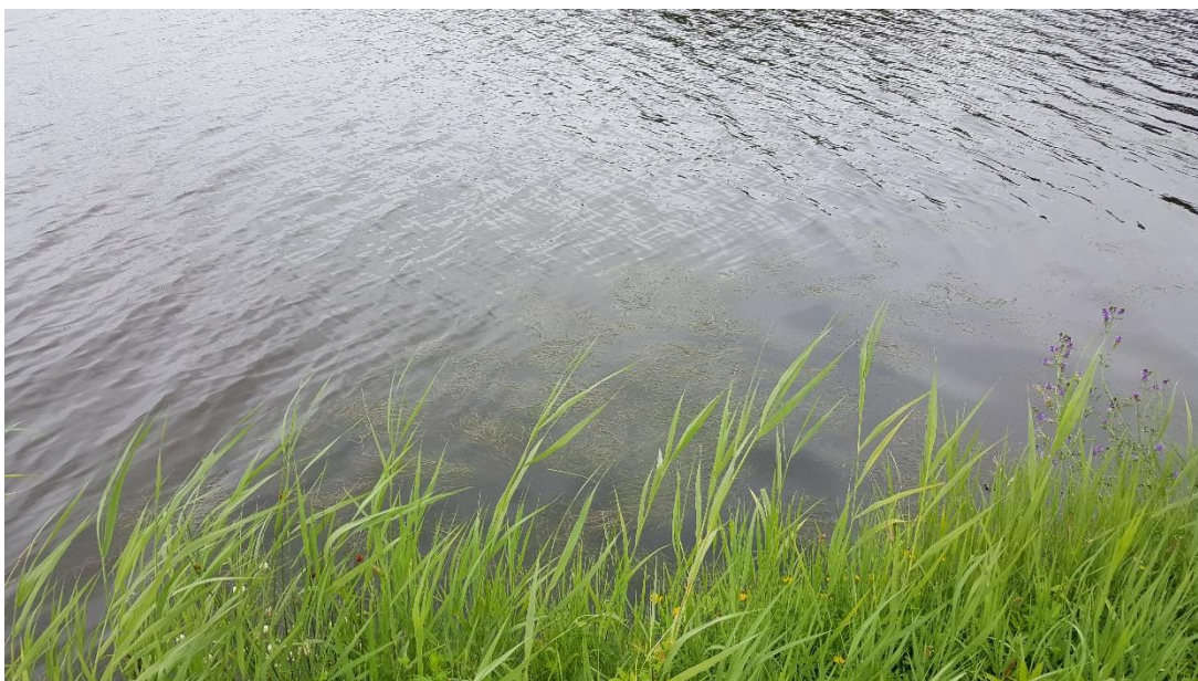
Figuur 3: Foto locatie tijdens veldbezoek op 16 juli 2019.